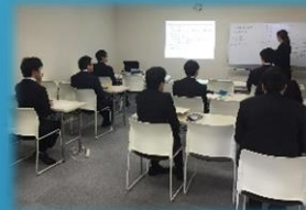
ビジネスマナーの講座風景です