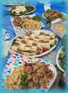
食事は美味しかったです