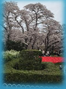
桜はきれいに咲いていました