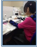
事務仕事を している様子